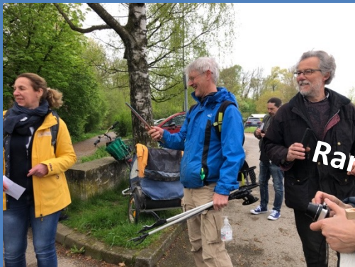
Ramada mit 3 Schulen