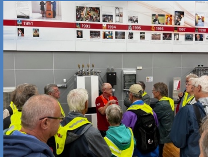
Exkursion zu Fa. Wolf, Wärmepumpen in Mainburg