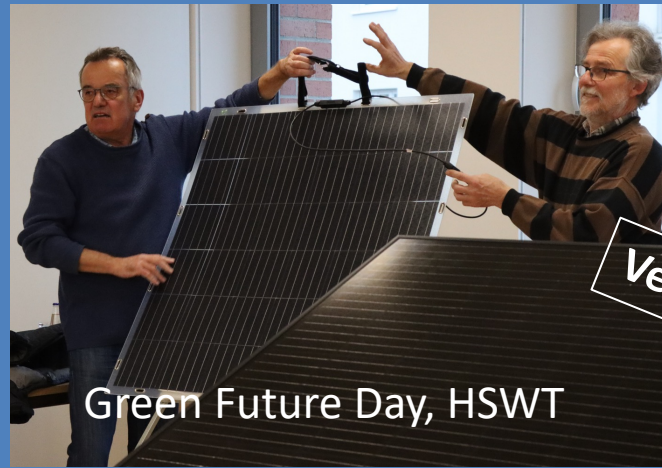
Green Future Day, HSWT

Teste dein Wissen zu Energie, Mobilität, Abfallvermeidung, Klima und Umwelt