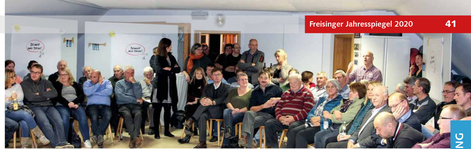
Im engen Schulterschluss mit der Bürgerschaft wurden in Pulling, Acherich, Hohenbachern und Kleinbachern die Ortsentwicklungsziele ausgelotet. Jetzt startet dieser Prozess auch in Attaching.

Ebenso erfolgreich verlief, nach anfänglicher Skepsis, in Hohenbachern und Kleinbachern die Bürgerbeteiligung bis zum Beschluss der Rahmenpläne im Dezember 2019. Diese definieren das grundsätzliche Anliegen, den geschätzten dörflichen Charakter zu wahren, und ebenso Projekte,