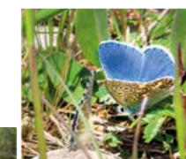
Lebensräume für Flora und Fauna sind an der Moosach entstanden. Der Himmelblaue Bläuling fühlt sich an der Schleiferbachquelle wohl.

Weniger im öffentlichen Blick ist momentan die Pflege der Ausgleichsflächen. Im Herbst 2014, noch vor Baubeginn der Westtangente, waren erste Biotope angelegt worden. Die Erfolgsgeschichte der Naturschutzmaßnahmen setzt sich mittlerweile in der sechsten Vegetationsperiode fort. Stellvertretend für die Vielzahl an ökologisch aufgewerteten Flächen zeigt sich an der Moosach (westlich von Pulling) und in Nähe der Schleiferbachquelle, dass sich seltene und bedrohte Pflanzen- und Tierarten angesiedelt haben – einige gehörten vor Jahrzehnten zum charakteristischen Artenspektrum des Freisinger Mooses und galten zwischenzeitlich als verschollen.