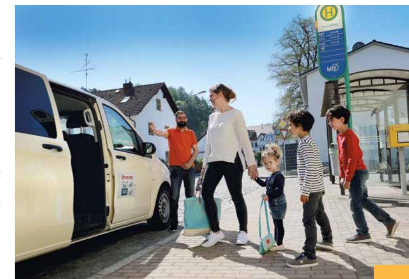
Bequem, flexibel und günstig: Das Ruftaxi wird von immer mehr Nutzer*innen geschätzt.

Das Ruftaxi soll es Menschen ohne Auto ermöglichen, von Orten, die nicht oder selten an die Stadt- oder Regionalbusse angebunden sind, Freising und den Bahnhof flexibel und zu attraktiven Preisen zu erreichen. Und so funktioniert's: Abfahrtszeit aus dem Fahrplan aussuchen, mindestens 30 Minuten vor Start des Ruftaxis an der ersten Haltestelle anrufen, Abfahrtszeit mit Datum, Einstiegsstelle, Ausstiegswunsch und Zahl der mitfahrenden Personen angeben – und schon geht es los.