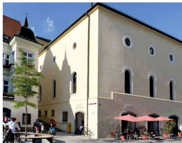
Die Korbinianschule in der Altstadt wird barrierefrei ausgebaut zur Inklusionsschule mit weiteren Fachräumen.

Umfassende bauhistorische Untersuchungen haben bereits stattgefunden, ebenso Abstimmungen mit dem Landesamt für Denkmalpflege. Bei diesem Projekt sind allerdings noch viele Details im Zuge der bevorstehenden Bedarfsermittlung zu klären. Der vorläufige Terminplan sieht einen Baubeginn 2023 mit einer zweijährigen Sanierungszeit vor.