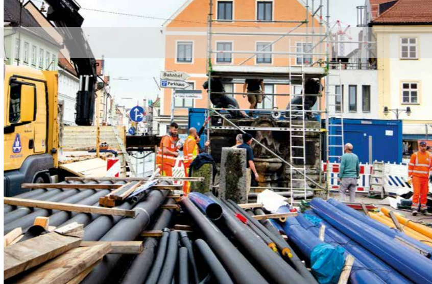
Hätten Sie es gewusst? Nahezu alle Gebäude in der Altstadt haben keinen Keller. Wie in Venedig werden sie nur von Eichenpfählen gestützt. Das Bachbett der Moosach gründet ebenso auf Holzpfählen. Damit sowohl Häuser als auch das neue Bachbett gesichert sind, werden mit aufwendiger Bohrtechnik massive Betonpfähle eingesetzt (Bilder links). Parallel dazu wird bereits gepflastert (unten). Das Bild oben zeigt das Rohrlager für das Wärmenetz vor dem mittlerweile abgebauten Kriegerdenkmal.

die betroffenen Anlieger*innen auf dem Laufenden gehalten werden. Diese müssen während der Bauarbeiten Einschränkungen, Belastungen und Umwege in Kauf nehmen. Wenn alle an einem Strang ziehen, bei Problemen das Gespräch gesucht und gemeinsam Lösungen gefunden werden, kann dieser beschwerliche Weg erfolgreich gemeistert werden. Ziel der Neugestaltungsmaßnahme ist schließlich eine Stärkung der der Innenstadt als Begegnungs- und Erlebnisraum und wirtschaftliches Zentrum, wovon alle profitieren werden.