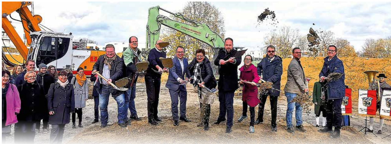
Denkwürdiger Tag: Mit dem Spatenstich am 6. November 2019 fiel der Startschuss für den Neubau der SteinPark-Schulen. Das Luftbild der Baustelle, aufgenommen im Juni 2020, zeigt den erfreulichen Baufortschritt.