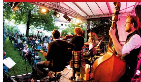
Bilder vom mitanand-Festival (unten, von links): Ausstellung der Künstlergruppe „Nestwerk“ und fröhlicher Musik- und Tanzabend der Lebenshilfe-Gruppe „Flotte Lotte“ im Furtner