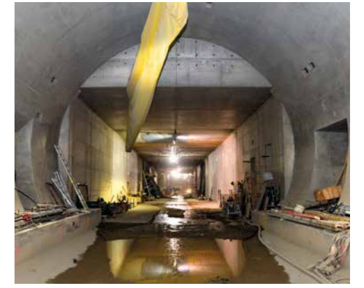
Straßen- und Brückenbau (linke Seite): Die Angerstraße ist jetzt über die Westtangente angeschlossen; an der Thalhauser Straße sind die Brücken über den Thalhauser Graben und den Geh- und Radweg fertiggestellt. Tunnelbau (von links oben im Uhrzeigersinn): Eingang Nordportal; Durchbruch zwischen bergmännischer und Deckelbauweise; freier (Durch)Blick von Nord nach Süd; Betonieren der letzten Sprießsohle; Tunnelausgang Südportal.