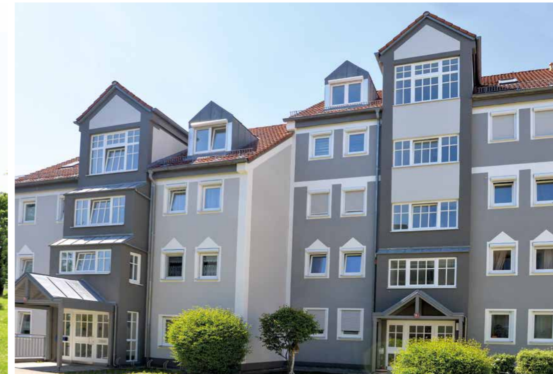
Innovativ und dringend zur Entlastung des Wohnungsmarkts benötigt: An der Katharina-Mair-Straße entstehen 115 Mehrgenerationenwohnungen (Fotos oben). Auch optisch eine Zier: Die Freisinger Wohnbau hat die Gebäude an der Angermaierstraße sorgsam saniert.

Fotos: Stadt Freising (3), Illustration: 3D Artifex UG Co. KG