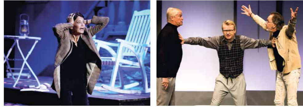
Theateraufführungen (von links): Die falsche Schlange; Komplexe Väter; Nein zum Geld