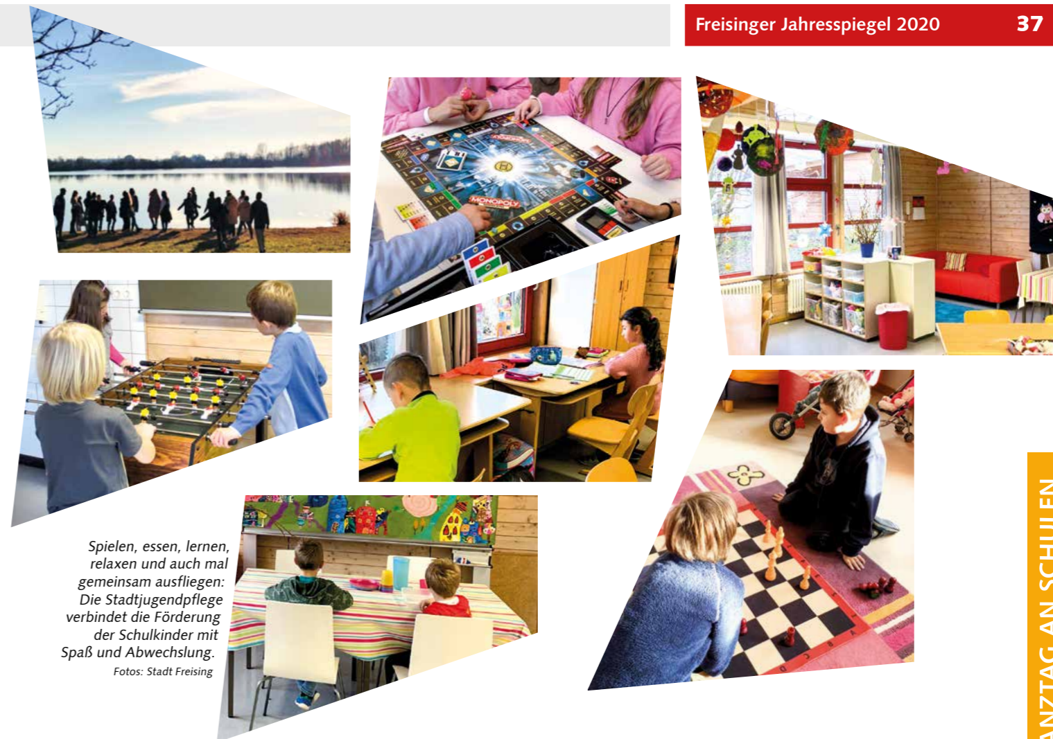
Spielen, essen, lernen, relaxen und auch mal gemeinsam ausfliegen: Die Stadtjugendpflege verbindet die Förderung der Schulkinder mit Spaß und Abwechslung.