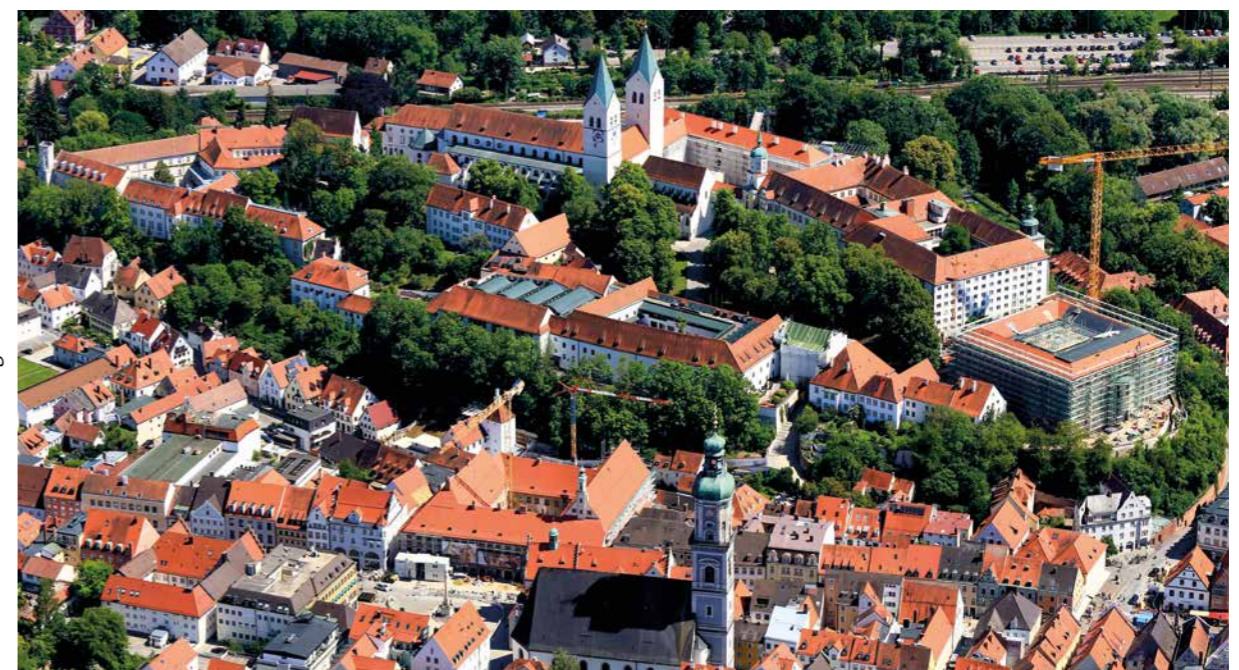
Luftbild der Freisinger Altstadt

Freising zeigt mit Unterstützung der Förderprogramme, wie sich das Stadtbild richtungsweisend verändern kann. Die hier aufgeführten Projekte stehen stellvertretend für weitere Einzelvorhaben, Machbarkeitsstudien und Leitfäden einer aktiven Stadtplanung. Den bundesweit jährlich veranstalteten „Tag der Städtebauförderung“ nutzt die Stadt, um ihre Initiativen und die baulichen Fortschritte der Stadtsanierung einer breiten Öffentlichkeit nahezu-bringen. Mit Erfolg: Auch Privatleute investieren in die Sanierung ihrer Gebäude. Der Stadt Freising ist es möglich, diese Aktivitäten mit Mitteln aus der Städtebauförderung zu unterstützen.