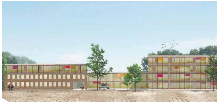
Ansicht des Erweiterungsbaus für die Grundschule St. Lantbert in Lerchenfeld (links), der bei planmäßigem Verlauf im September 2022 in Betrieb gehen könnte. Die Illustration rechts zeigt den Vorentwurf für die Schule Vötting mit dem zurückgesetzten Aula-Anbau und dem sich rechts davon anschließenden neuen Lernhaus. Illustrationen: Hrycyk Architekten (1), balda architekten (1)