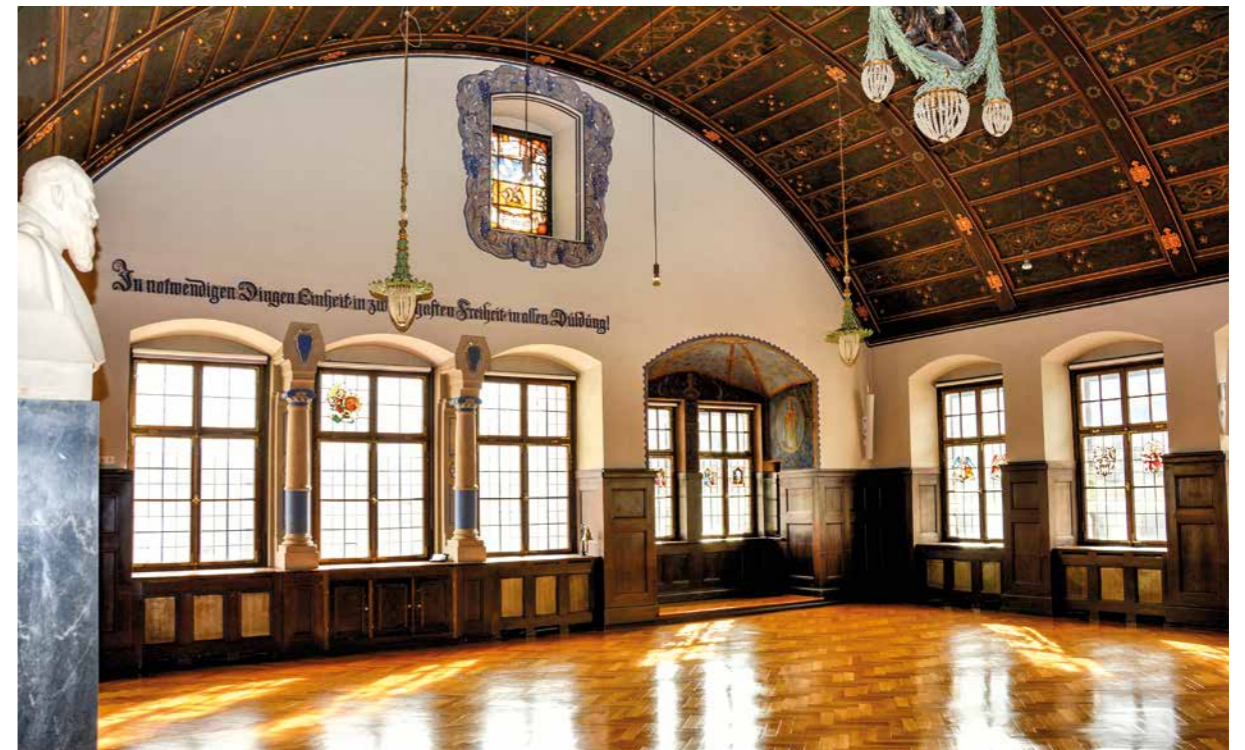
Der historische Große Saal im Freisinger Rathaus ist unter normalen Umständen der Sitzungsort des Stadtrats. Derzeit finden hier die Zusammenkünfte in kleiner Besetzung wie der Ausschüsse statt.

schuss für Bildung, Kultur und Sport, Werkausschuss Eigenbetrieb Stadtwerke, Werkausschuss Stadtentwässerung und Rechnungsprüfungsausschuss.