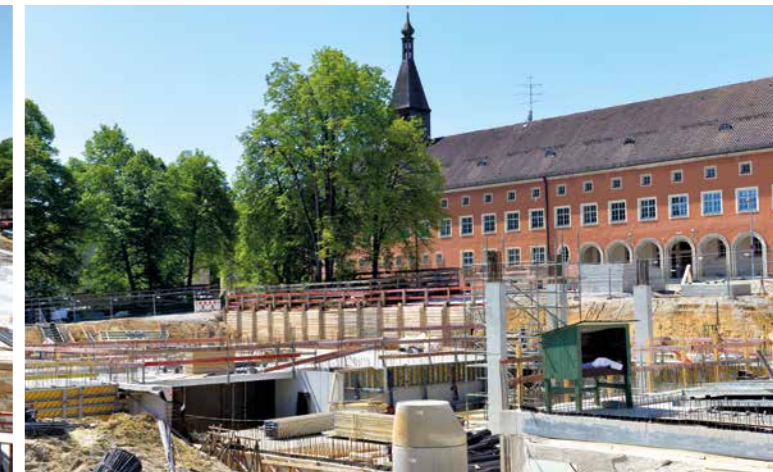
Blick vom ehemaligen Stabsgebäude auf die Großbaustelle im SteinPark. Die neue Grund- und Mittelschule entsteht parallel zum Stabsgebäude, östlich der Mittelschule wird die Dreifachsporthalle an der General-von-Stein-Straße errichtet.