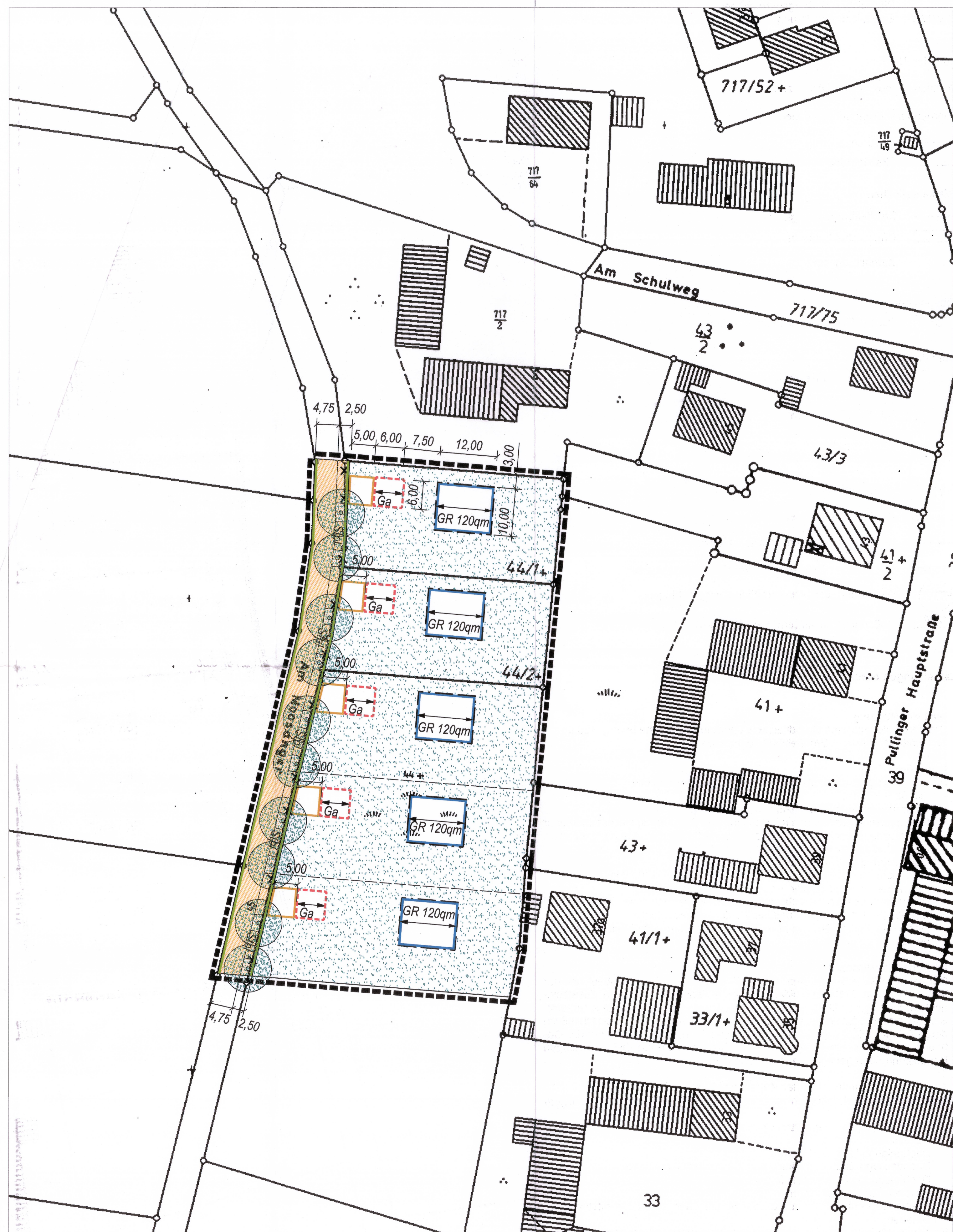
Maßstab M 1:500