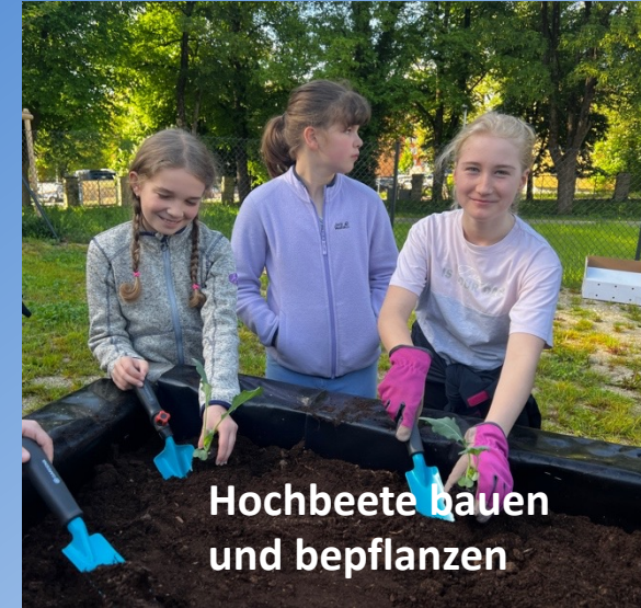
Hochbeete bauen und bepflanzen