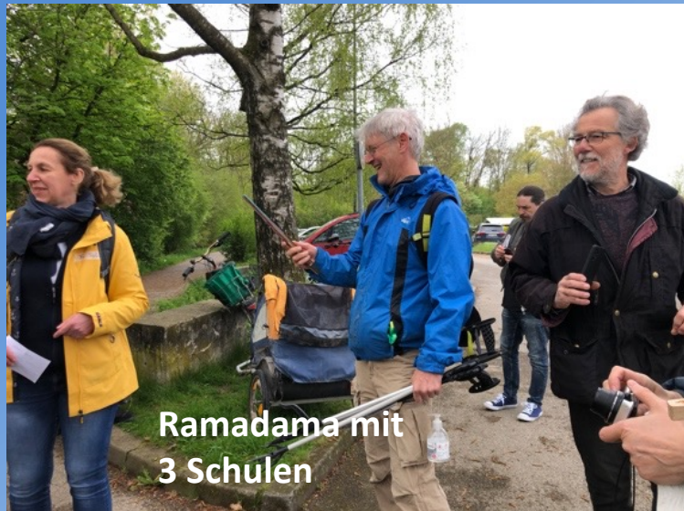
Ramadama mit 3 Schulen