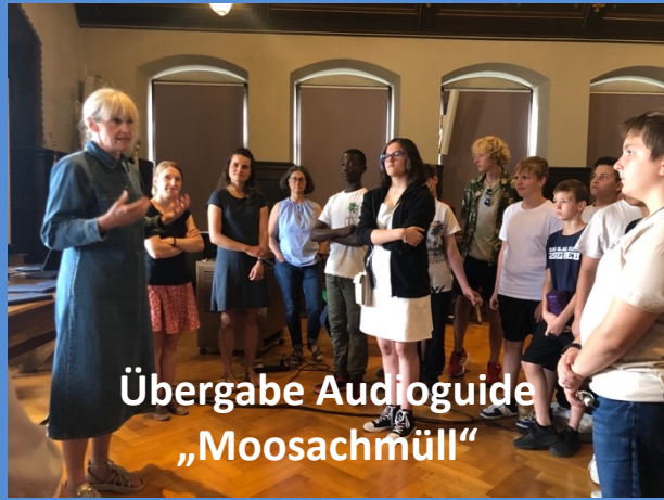
Übergabe Audioguide „Moosachmüll“