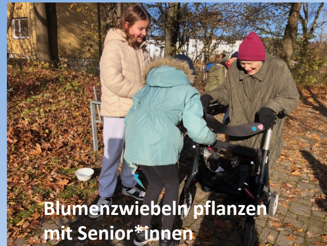
Blumenzwiebeln pflanzen mit Senior*innen