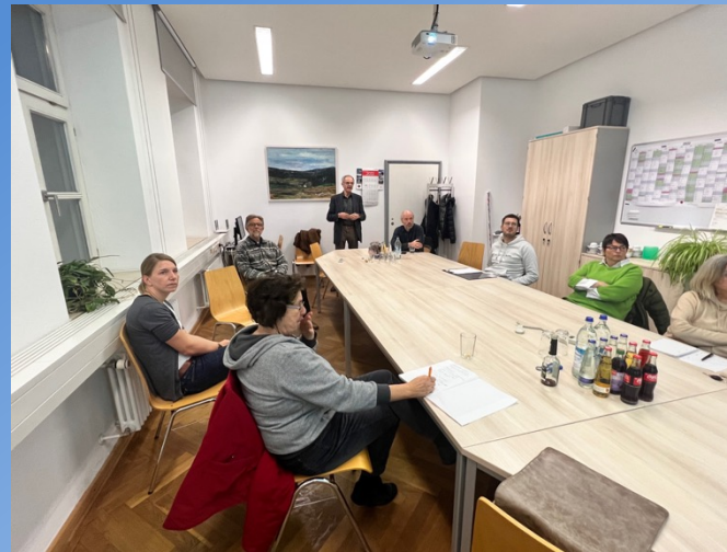
Grundlagen der Heizungstechnik (Hans Stanglmair)