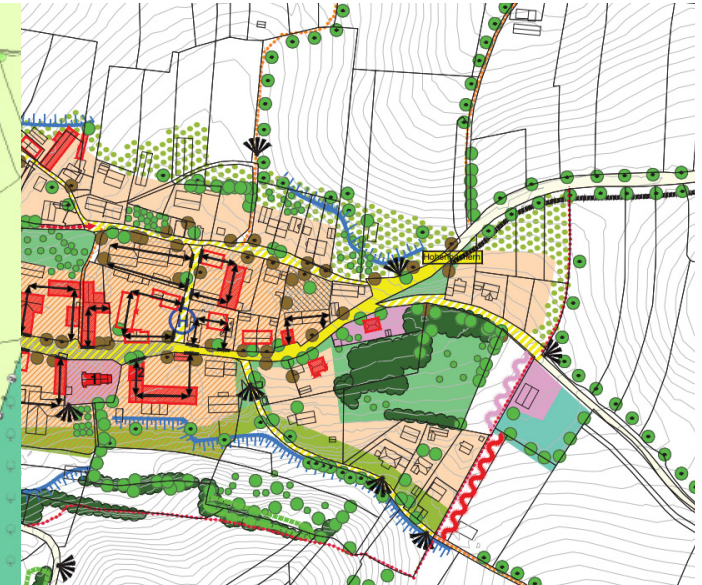
(Bsp: Rahmenplan Hohenbachern © Stadt Freising)